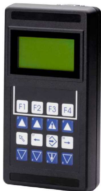
Fig. 1 Console de commande