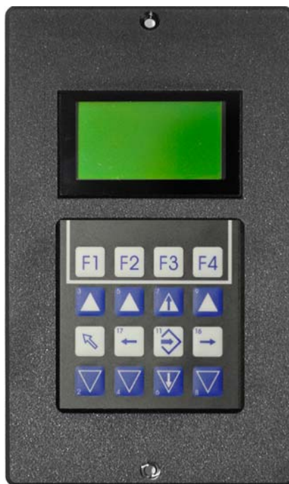
Fig. 3 Console de commande dans le cadre de montage sur panneau